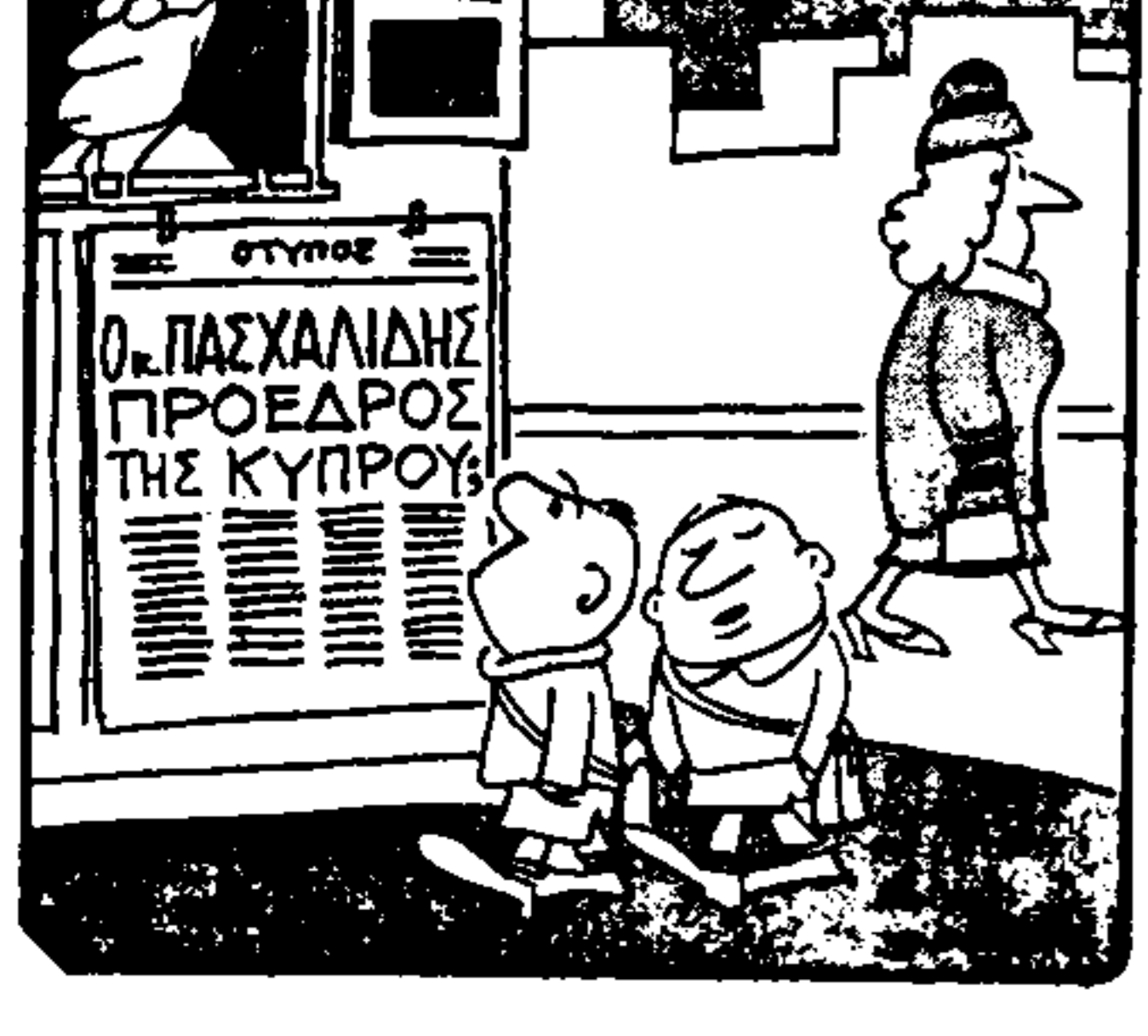
Λόγο Πάσχα! (Το Κάιτε Μπρέντσελ)