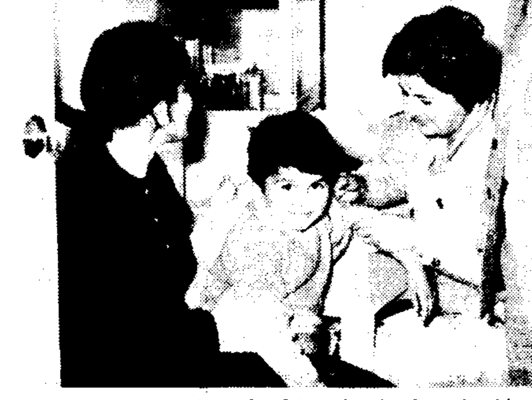
Στην άποψη από τον παρατηρητή έμβολιασμού κατά μολυσμακό φάσμα...